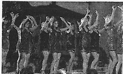
Quinta tappa provinciale del concorso Miss Italia