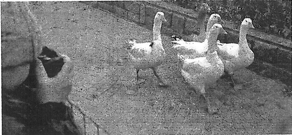
Un momento della tradizionale gara delle oche per la festa di San Martino a Cortina

la gara non provengono da Paesi dell'ex Unione Sovietica; sono state allevate a Cortina e alimentate con verdura, crusca e cereali e libere di pascolare sotto i frutteti. Di doping quindi non se ne parla». La corsa delle oche è abbinata a una sorta di lotteria e la vin-