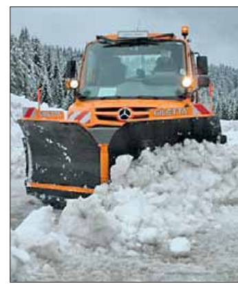
Schneeräumung ist „ordentliche“ Instandhaltung und muss von den Gemeinden bezahlt werden.